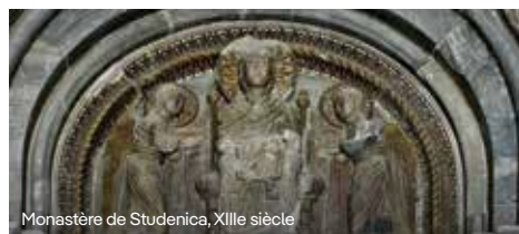
Monastère de Studenica, XIIIe siècle

nia), ont érigé de nombreux monastères, préférant construire ces édifices spirituels plutôt que des palais somptueux. Leur fondation est un témoignage de foi, de persévérance et d'engagement envers les valeurs spirituelles.