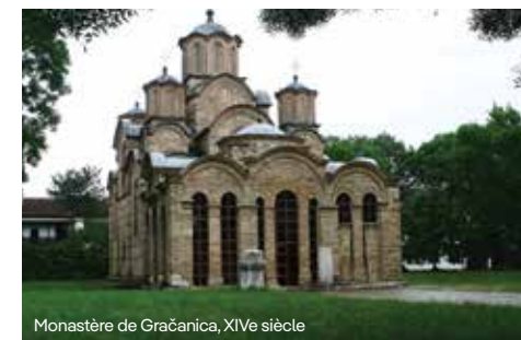
Monastère de Gračanica, XIVe siècle

Le roi Milutin a érigé plus de quarante sanctuaires religieux durant sa vie. D'éminents architectes de Constantinople et de Thessalonique ont édifié à travers le Kosovo des églises cruci-formes inscrites dans un carré, couronnées d'un à cinq dômes, parées extérieurement de frises en pierres et briques. Gračanica incarne le summum de cette architecture, un monument à la fois harmonieux et dynamique, évoquant une quête de verticalité, où la vision byzantine de l'église comme reflet du cosmos trouve sa pleine expression. Le roi Milutin a fait venir de Byzance les illustres peintres Mihajlo et Eutychi pour orner ses édifices. Leurs fresques remarquables dans l'église Notre-Dame de Ljeviška, parmi d'autres constructions royales, rivalisent avec les plus grands chefs-d'œuvre de Constantinople de l'époque.