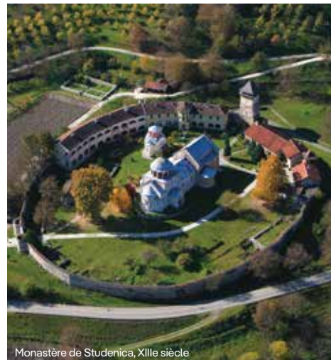
Monastère de Studenica, XIIIe siècle

*Les monastères présentés ici sont de tradition orthodoxe. Pour en savoir plus sur les lieux de culte d'autres confessions, visitez www.serbia.travel .