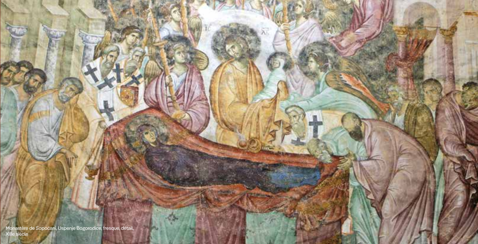
Monastère de Sopoćani, Uspenje Bogorodice, fresque, détail, XIIIe siècle

Les visages solennels et épanouis de Sopoćani dégagent une beauté intérieure et une noblesse d'expression remarquables. Cette approche artistique, héritée d'une époque révolue, évoque une renaissance où l'on célèbre la splendeur de l'essence humaine. Sopoćani est considéré comme la Chapelle Sixtine de l'époque médiévale serbe, un trésor de l'art et de la spiritualité.