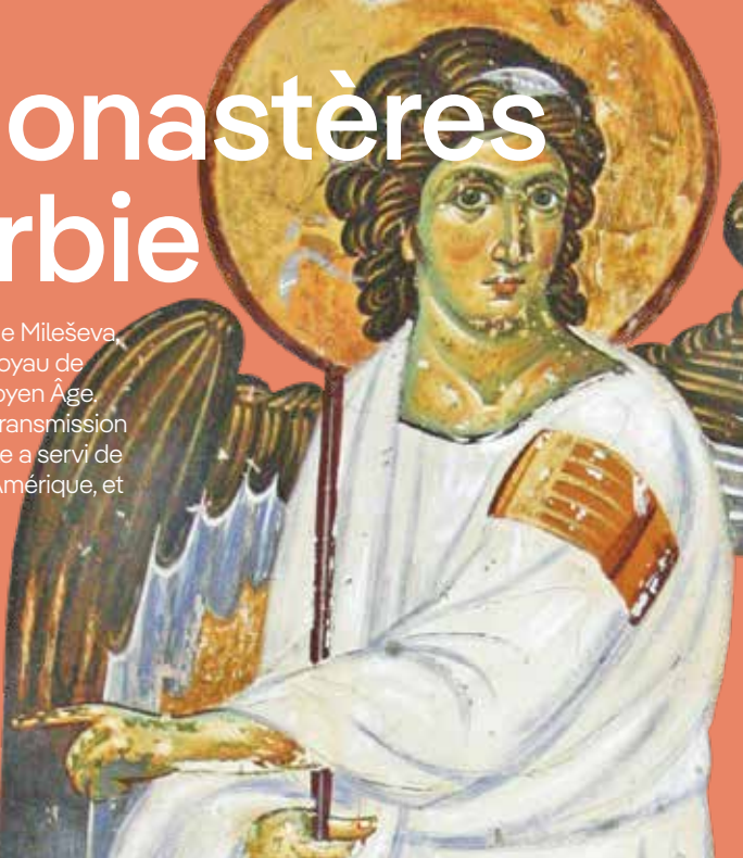
Monastère de Mileševa, Ange Blanc, fresque, détail, XIIIe siècle

La fresque « L'Ange blanc » de Mileševa, datant du XIIIe siècle, est un joyau de l'art serbe et européen du Moyen Âge. Diffusée lors de la première transmission vidéo par satellite en 1963, elle a servi de salutation de l'Europe vers l'Amérique, et plus tard, dans l'espace.