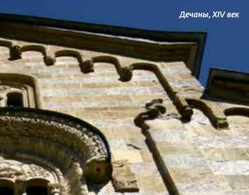
Decani, XIV век

Сильное сербское государство распалось после смерти царя Душана. После нашествия на Балканы османских турок, центр сербского государства переместился на север, в долину реки Морава. В княжестве Лазаря Хребляновича и его сына деспота Стефана, вопреки хаотической политической ситуации, культура достигает полного расцвета.