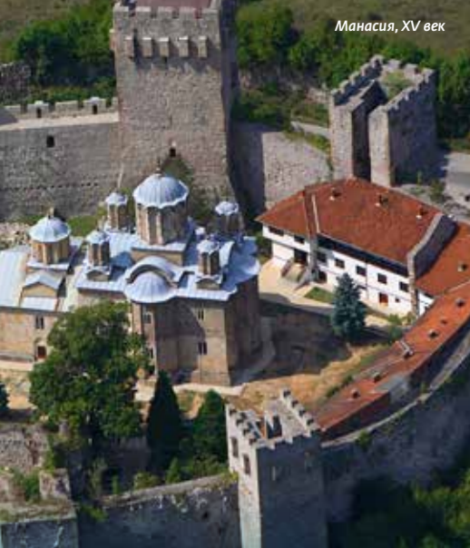
Манастир, XV век