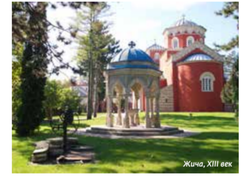
Жича, XIII век

МОНАСТЫРИ – ОСНОВА ИДЕНТИЧНОСТИ В XIII веке, когда могущество Византии слабело, наследники Немани получили возможность развивать собственную государственную, национальную и культурную самобытность. Особо важную роль тогда сыграл монастырь Жича, в котором был коронован первый сербский король Стефан Первовенчанный, и который благодаря Савве Неманичу (Святой Савва Сербский) стал центром самостоятельной сербской архиепископии. Идея об идеальном христианском сочетании церковной и государственной власти нашла свое воплощение в монастырях, которые становились духовными, политическими и культурными центрами сербов.